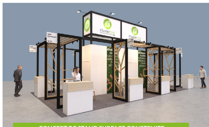
CONCEPT DE STAND SURFACE CONSTRUITE