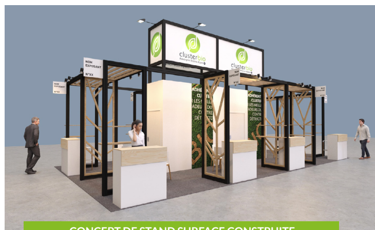
CONCEPT DE STAND SURFACE CONSTRUITE

Angle : forfait de 375€, sous réserve de disponibilité, à partir de 12m 2